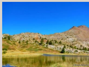
Massif du Chenaillet