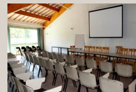
Une salle de réunion