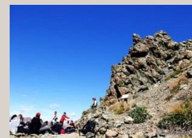
Observations sur le terrain