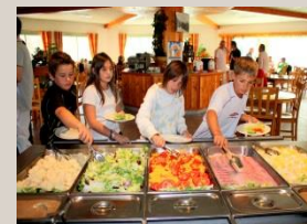
Un self service