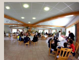
Une salle de restauration très agréable