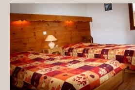
Des chambres twins avec vue sur notre patrimoine naturel